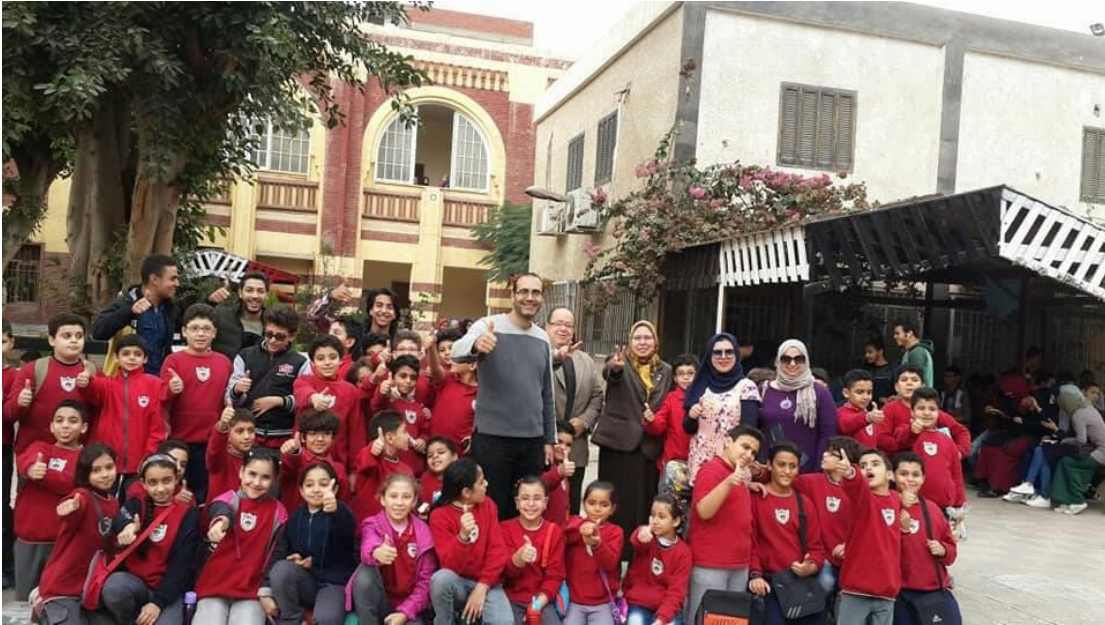
٣- زيارة وفد طلاب مدرسه ناصر للغات للتعليم الاساسى بتاريخ ٥-١٢-٢٠١٧م