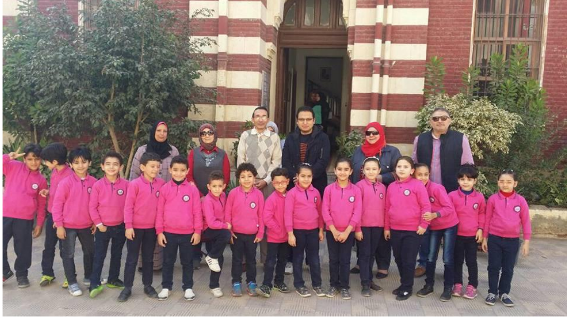
٥- زياره وفد طلاب مدرسه طلخا الابتدائيه الرسميه للغات بتاريخ ٣-٤-٢٠١٨م