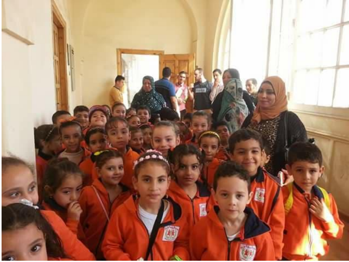
٢- زيارة وفد طلاب مدرسه الفردوس للتعليم الاساسى بتاريخ ٢٥-١١-٢٠١٧م