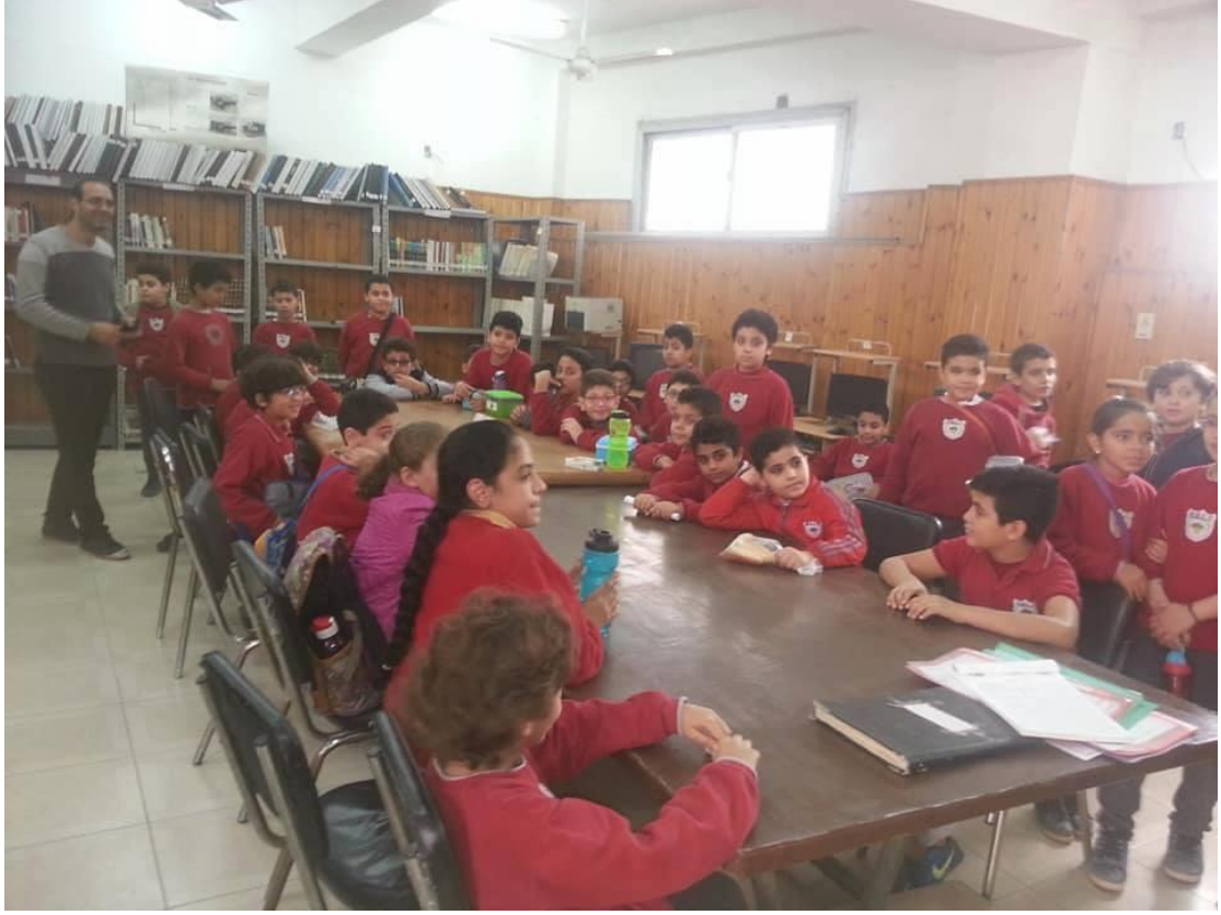
٤- زياره وفد طلاب مدرسه الشهيد المقدم احمد حسن رشاد الابتدائيه بتاريخ ١٠-٧-٢٠١٧م